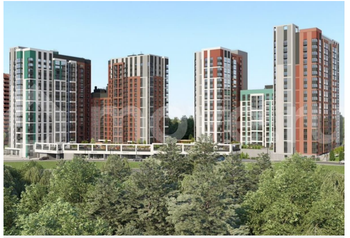
Многоквартирный жилой комплекс (Дом №1, Дом №2) на улице Камбарская, город Ижевск 1 этап строительства. Жилой дом №1

Примечание: 1. В фойе расположены различные помещения в зависимости от варианта отделки и комплектации. 2. На плане указаны возможные места установки оборудования: сплит-системы, кондиционеры, вентиляторы, сантехническое оборудование. 3. Высота помещений: квартира - 2.4 м, чердак в мансарде - 1.0 м. 4. Высота ограждений парков и балконов 1.2 м.