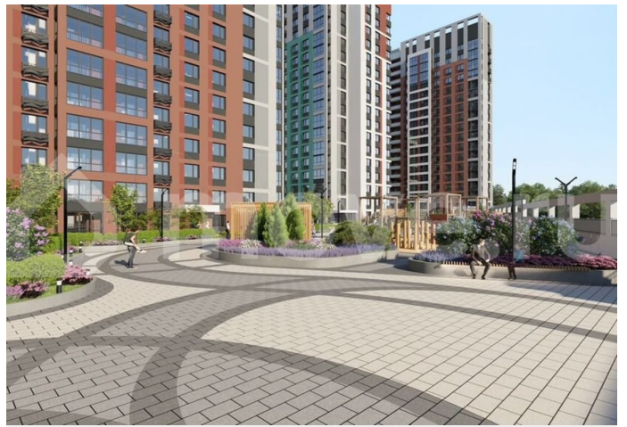
Многоквартирный жилой комплекс (Дом №1, Дом №2) на улице Камбарская, город Ижевск 1 этап строительства. Жилой дом №1

Примечание: 1. Расположение мебели и оборудования в помещениях является условным. 2. Чертеж в масштабе 1:75.