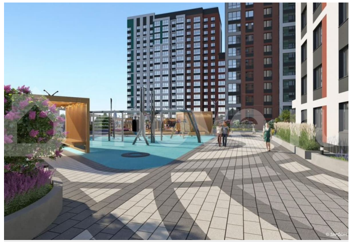
Многоквартирный жилой комплекс (Дом №1, Дом №2) на улице Камбарская, город Ижевск 2 этап строительства. Жилой дом №2

Примечание: 1. Расположение мебели и оборудования в помещениях приведено условно. 2. Чертёж в масштабе 1:75.