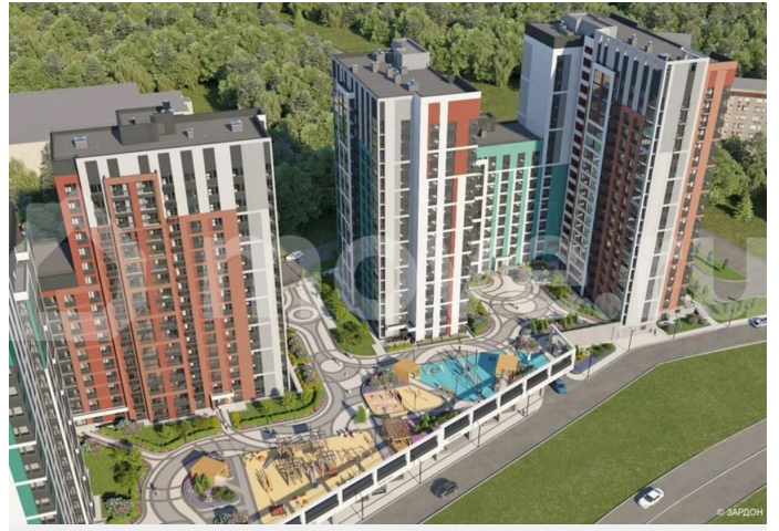
Многоквартирный жилой комплекс (Дом №1, Дом №2) на улице Камбарская, город Ижевск 2 этап строительства. Жилой дом №2

Примечание: 1. В проекте строительства включены изменения и разделение пространств общей территории комплекса. 2. На плане указаны возможные места установки сантехнических приборов, санитарно-технического оборудования. 3. Высота помещений квартир 2.34 м. 4. Чертёж в масштабе 1:75.